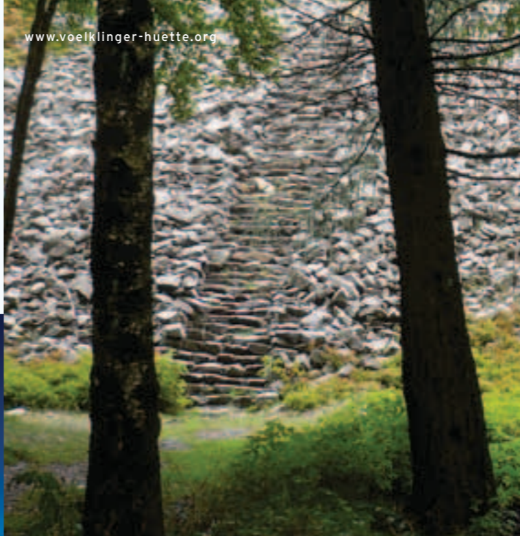
Keltischer Ringwall Nonnweiler-Otzenhausen