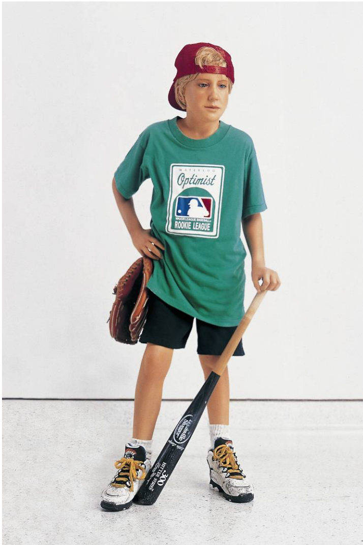
Kid with Baseball Bat 1995 Epoxidharz, farbig bemalt, Mischtechnik, Accessoires Sammlung Hanson, Davie, Florida

Während seines Schaffens erhielt Hanson verschiedene Preise und Auszeichnungen wie z.B. den Florida State Fare Award of Merit und den Ambassador of the Arts Award. Außerdem wurden ihm von mehreren amerikanischen Universitäten Ehrendokortitel verliehen.