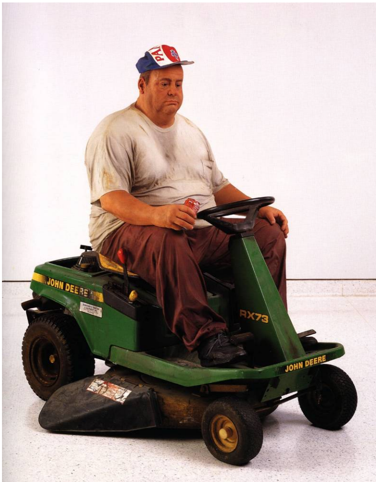
Man on a mower 1995 Bronze polychromed, with lawnmower Hanson Collection, Davie, Florida Cat. p. 159

Der (gescheiterte) amerikanische Traum und dessen Folgen, die sich unauslöschlich in den Gesichtern und der Haltung der Dargestellten eingegraben haben, rücken in das Zentrum seines Schaffens.