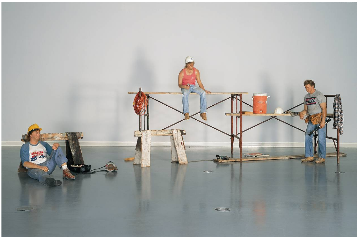
Lunchbreak 1989 Polyvynil, polychromed in oil, mixed media, with accessories Hanson Collection, Davie, Florida Cat. p.138-139