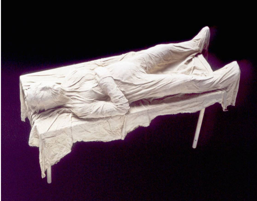
Abortion 1965 Wood cloth plaster and mixed media Hanson Collection, Davie, Florida Cat. p. 15