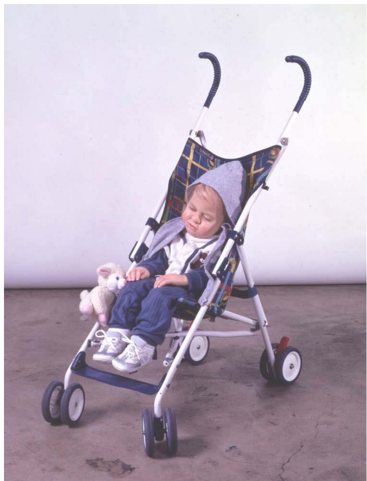
Baby in Stroller 1983

am 6. Januar erliegt Duane Hanson in Florida seinem Krebsleiden.