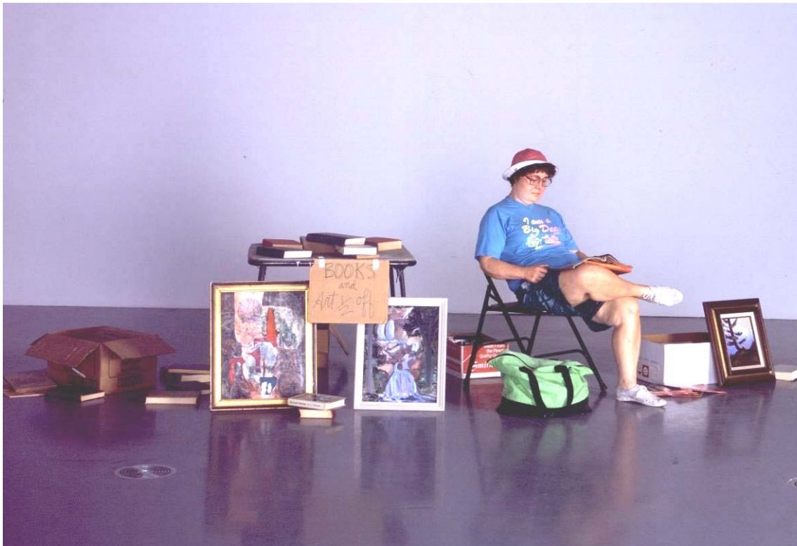
Flea Market Lady 1990

Im letzten Teil seines Schaffensprozesses schließlich kleidete Hanson seine Figuren so authentisch wie möglich und stattete sie gegebenenfalls mit den passenden Requisiten aus. Er bemühte sich sehr, alte, abgetragene Kleidungsstücke aufzutreiben, die zu ihnen passten, und denen in vielen Fällen sogar ein schmutziges, fleckiges Aussehen verliehen werden musste. Die Requisiten reichen von dem Tablett und dem Tuch der Kellnerin über die Taschen, Fotoapparate und Sonnenbrillen der Touristen bis hin zu dem Stuhl, den Büchern und den Bildern der Flea Market Lady (1990). Diese Gegenstände dienen nicht nur als Accessoires, die auf die besondere Arbeit, augenblickliche Beschäftigung oder Identität der Figuren hinweisen, sie tragen auch dazu bei, einen Einblick in ihre Lebensart, in ihre Vorlieben und Abneigungen zu