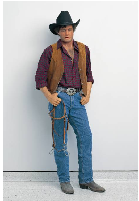
Cowboy 1984/1995 Bronze, polychromed in oil, mixed media, with accessories Hanson Collection, Davie, Florida Cat. p. 123