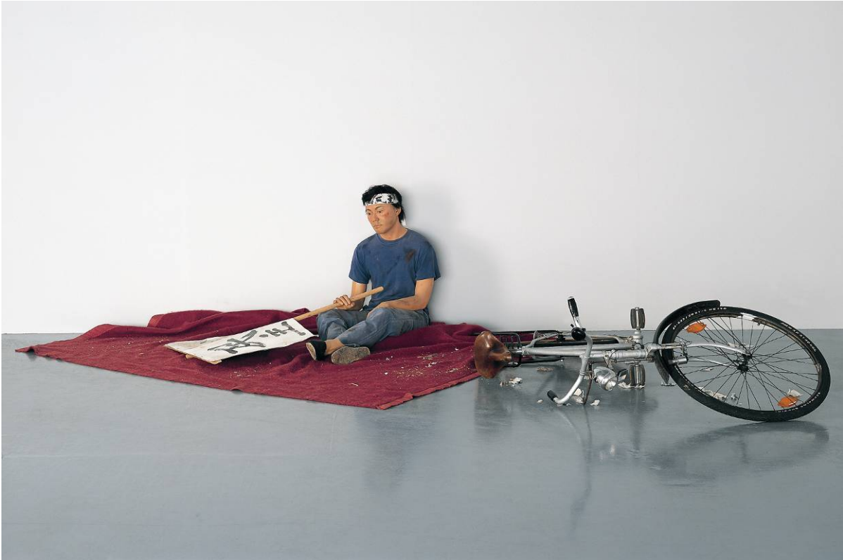
Chinese Student 1989 Auto body Filler, polychromed in oil, mixed media, with accessories Hanson Collection, Davie, Florida Cat. p. 136-137