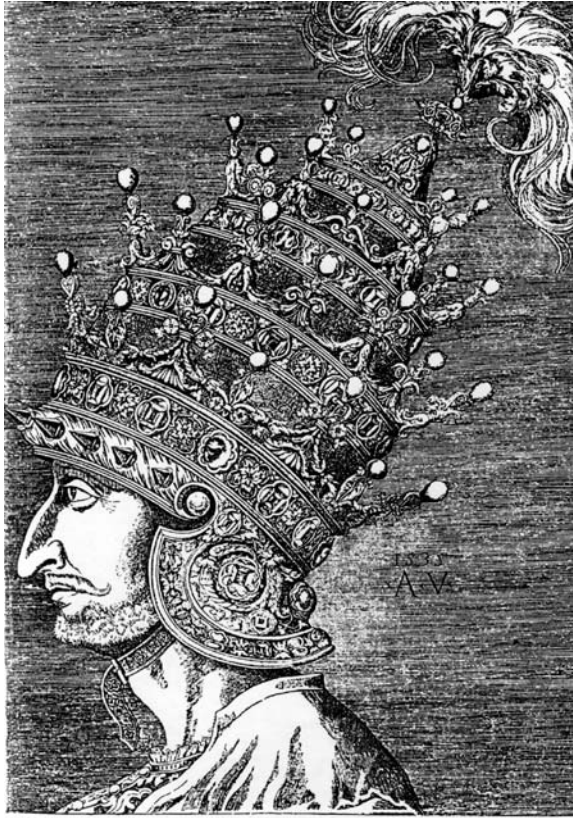
Portrait des Sultan Süleyman, des Prächtigen