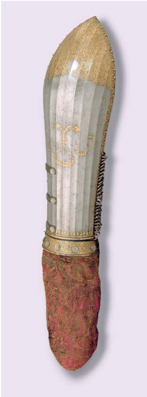
Armschiene (Elwan) von Sultan Süleyman II. (1494 - 1566) um 1560, osmanisch Eisen, z.T. tauschiert, Ringelgeflecht, Stoff, Silber Länge 59 cm Kunsthistorisches Museum Wien, Hofjagd- und Rüstkammer

Reich bei der Belagerung der westungarischen Festung Sziget, das von Nikolaus Zrinyi verteidigt wurde. Wegen seiner Vorliebe für die Künste und den Gartenbau wurde Süleyman "der Prachtige" genannt.