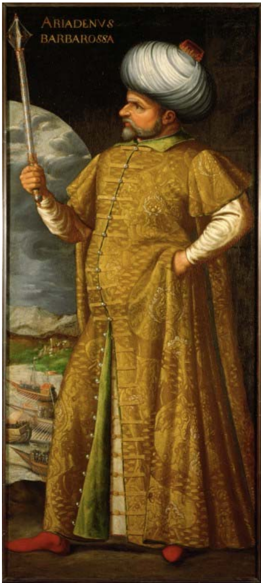
Bildnis des Chaireddin Pascha, genannt Barbarossa um 1580, italienisch Öl auf Leinwand 221 x 100 cm Kunsthistorisches Museum Wien, Gemäldegalerie

Das Osmanische Reich war spätestens seit der Eroberung Konstantinopels 1453 eine europäische Großmacht. Mit Gebieten in Nordafrika und Asien umfasste dieses Reich nahezu das gesamte heutige Südosteuropa. Ungarn, Bosnien, Serbien, Transsylvanien, die Walachei, Bulgarien und große Teile Griechenlands und Zyperns gehörten zum Osmanischen Reich. Nahezu ganz Arabien und Ägypten waren über viele Jahrhunderte Teil dieses Reiches. Die Vorstellung von Orient, Morgenland, islamischer Welt und Osmanischem Reich fielen aus der europäischen Perspektive zusammen. Generäle, Großwesire des Osmanischen Reichs, aber auch die Frauen der Sultane stammten aus Europa.