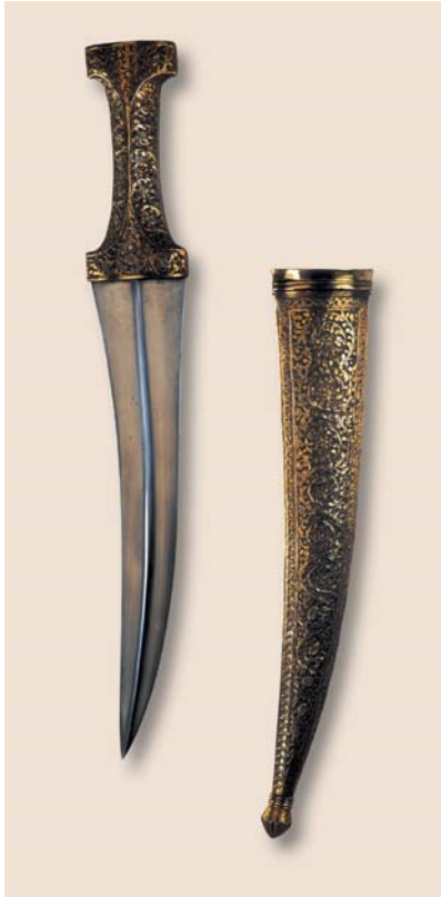
Prunkdolch mit Scheide 18. Jahrhundert, osmanisch Damaststahl, Silber Länge 41,5 cm Badisches Landesmuseum Karlsruhe

Niello In Gold oder Silber eingeritzte, mit schwarzer Schmelzmasse ausgefüllte Zeichnung in Metall