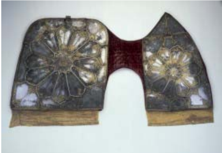
Gepanzerte Prunkschabracke 2. Hälfte 17. Jahrhundert, osmanisch Seidensamt, Stahl, Gold Höhe 66 cm, Länge 130 cm Badisches Landesmuseum Karlsruhe

für ihn im Krieg gegen die Österreicher. Der Sattel wurde 1683, als die Osmanen ohne Erfolg die Stadt Wien belagerten, erbeutet.