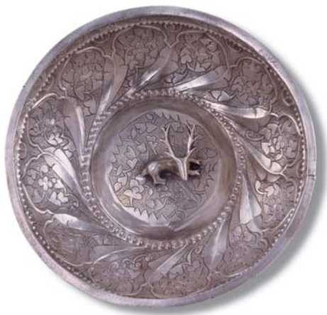
Silberne Schale 16. Jahrhundert, Balkan Silber Durchmesser 14 cm, Höhe 3 cm Ungarisches Nationalmuseum Budapest

Viele unserer Zeitgenossen sind Muslime wegen genau dieser Osmanen, deren Schätze du hier siehst: Die Osmanen verbreiteten nämlich ihre Religion in den Ländern, die sie besiegten. So kam der Islam auch bis ins Abendland, das zuvor jahrhundertlang christlich war.