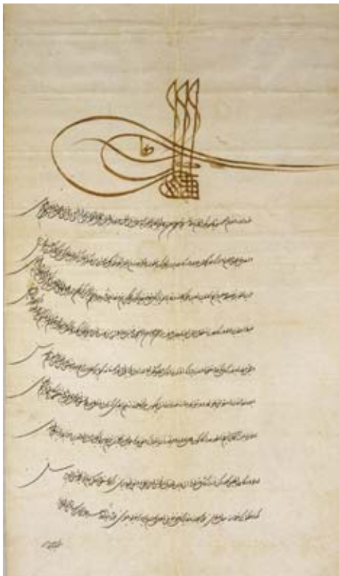
Befehlsschreiben Süleymans II. an den deutschen König Ferdinand I. Handschrift mit Tughra Süleymans II. 1541, ungarisch 86,5 x 41,5 cm Österreichisches Staatsarchiv - Haus-, Hof- und Staatsarchiv Wien

Tughra Kalligraphisch gestalteter Namenszug eines osmanischen Herrschers