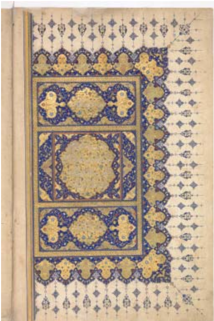
Koran des Osmanenprinzen Murad (1546 - 1595) 1562 - 1574, Schiras, persisch Handschrift, Papier, 322 Blätter 40,5 x 26,5 cm Bayerische Staatsbibliothek München

Das Schönschreiben, man nennt es auch „Kalligrafie“, wurde eine eigene Kunstform. Schönschreiber wurde ein richtiger Beruf, wie Maler oder Goldschmied. Die berühmtesten und besten Schönschreiber oder Kalligrafen wohnten in der Hauptstadt Istanbul.