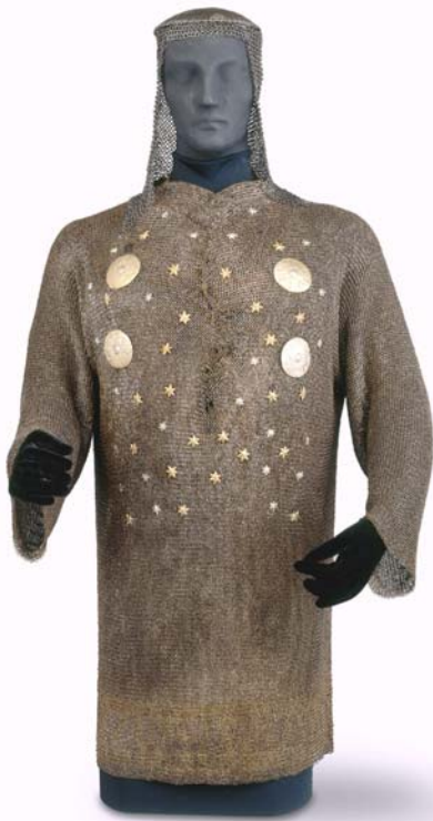
Panzerhaube und Panzerhemd eines Spahis 17. Jahrhundert, osmanisch genietete Ringe von verzinnem Kupferdraht, Eisen, vergoldet Höhe, montiert, 119 cm, Breite 59 cm Kunsthistorisches Museum Wien, Hofjagd- und Rüstkammer

Mehr als 400 Jahre lang gab es immer wieder Krieg zwischen dem Osmanischen Reich und den europäischen Mächten. Man kämpfte um Land, Macht und Religion. Riesige Schlachten kosteten viele Menschenleben. Die Osmanen hatten gut ausgebildete Fußsoldaten, eine Reiterei und auch eine gefährliche Seestreitkraft. Manchmal waren es fast 200 000 Osmanen auf einmal, die zum Krieg ins Feld zogen. Aber nicht alle waren kämpfende Soldaten: Es wurden auch viele Personen gebraucht, um die Soldaten mit Essen, Trinken und auch mit Waffen zu versorgen. Die Truppen des Sultans waren sehr erfolgreich: ihre Waffen waren besser als die europäischen und sie waren sehr gut organisiert. Lange dachte man, sie seien unbesiegbar.