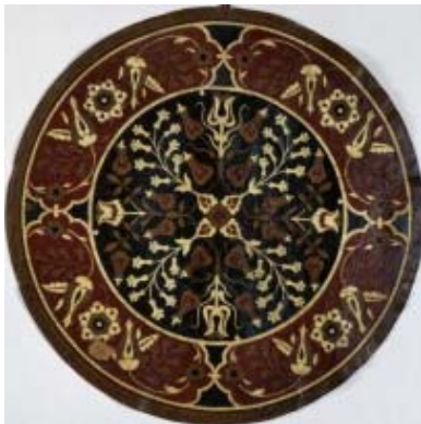
Lederteller 2. Hälfte 16. Jahrhundert, osmanisch Leder Durchmesser 51 cm Kunsthistorisches Museum Wien, Sammlungen Schloss Ambras

Das ist ein Seitenteil von einer Art Rüstungshemd für ein Pferd. Schließlich sollten auch Pferde im Kampf gegen Hiebe und Stiche geschützt werden. Für die Schabracke, so nennt man solche Pferddecke, wurden Stahlplatten auf gepolsterten Seidensamt montiert. Damit das Pferd sich trotz des Panzers bewegen konnte, wurden die einzelnen Platten lose miteinander vernietet.