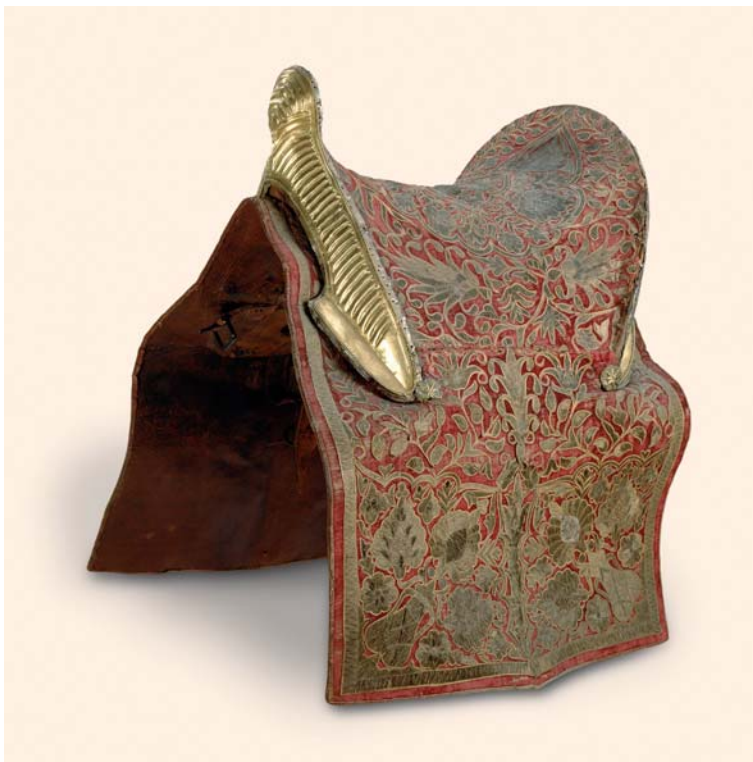
Orientalischer Sattel des Ghirai Khan (1678 - 1683) um 1680, osmanisch Vergoldetes Silberblech, Samt, Eisen bemalt, Leder, Rosshaar Länge 50 cm, Höhe 66 cm Kunsthistorisches Museum Wien, Hofjagd- und Rüstkammer

Die Osmanen stammten von einem Reitervolk ab, das in der Steppe Zentralasiens lebte. Ihre Vorfahren waren Nomaden, wohnten also nicht an einem festen Ort in Häusern sondern zogen auf ihren Pferden umher und übernachteten in Zelten. Zu der Zeit, aus der unsere Schätze kommen, wohnten die Osmanen aber schon längst in Häusern und Palästen. Trotzdem spielte das Reiten und Zelten eine große Rolle in ihrem Leben.