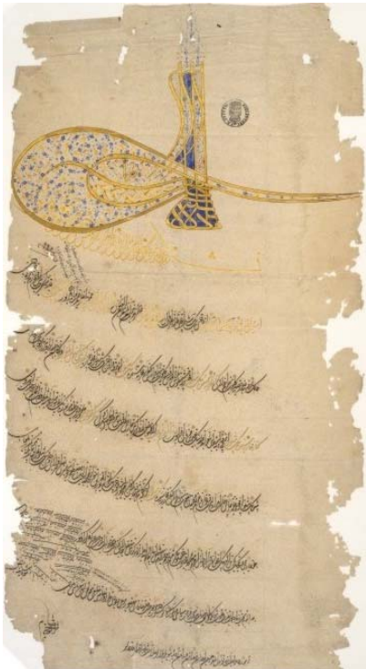
Sultanische Ernennungsurkunde Hamza Agas zum Subaschi 1584, Istanbul, osmanisch Papier 66,4 x 36 cm Württembergische Landesbibliothek Stuttgart

Die Schönschreibkunst wurde für alle wichtigen Schriftstücke verwendet. Vor allem für offizielle Schreiben vom Sultan oder seinem Stellvertreter, dem Wesir. Solche Briefe, Urkunden und Befehle wurden mit der kunstvollen „Tughra“ versehen. Die Tughra war so etwas wie das Siegel oder der Amtstempel des Sultans. Es gab sogar eigens einen Hofbeamten für die Tughra. Er zeichnete sie nach bestimmten Regeln sorgfältig in schwarzer und auch farbiger Tusche. Die Tughra enthielt den Namen des Sultans, den Name seines Vaters und manchmal auch einen Beinamen, wie z.B.: „der allzeit Siegreiche“. Oft dekorierte der Tughra-Maler seine Zeichnung mit Blumen und Ranken.