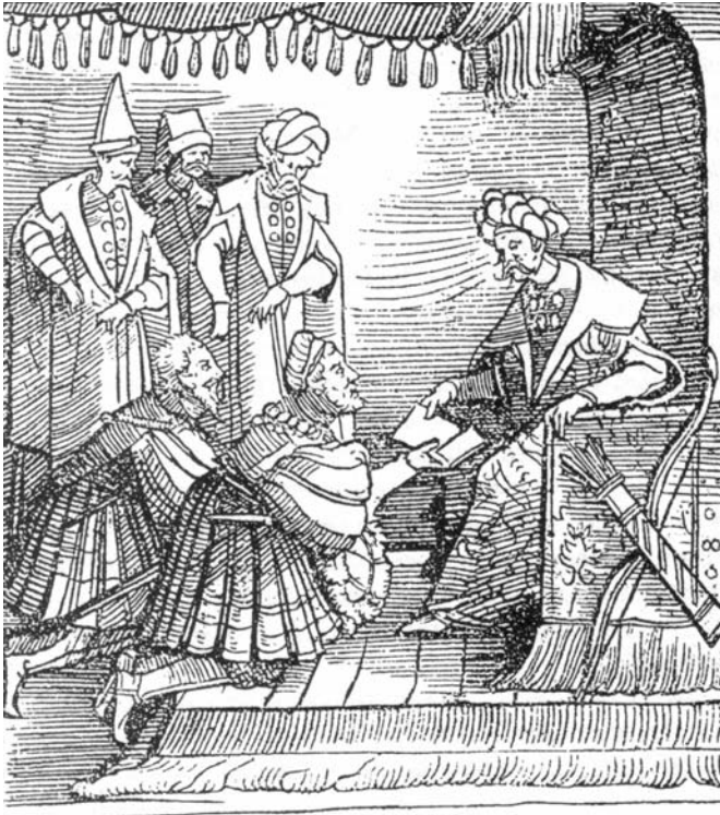
Sultan Süleiman, der Prächtige empfängt ausländische Botschafter zeitgenössischer Stich aus dem Jahr 1531