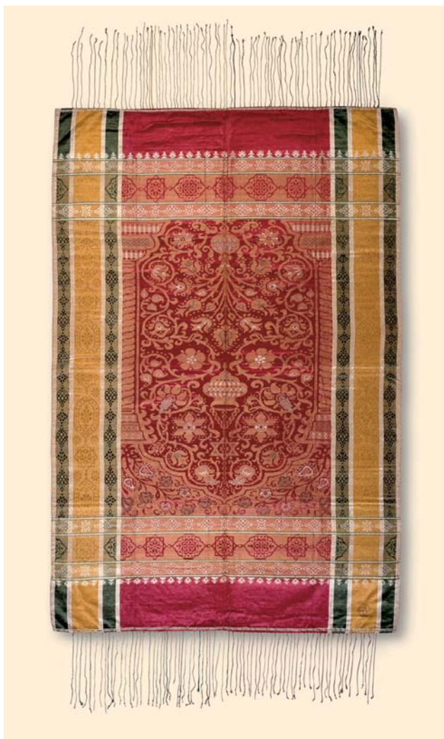
Zelt-Teppich aus Seidenatlas mit Gebetsnische 19. Jahrhundert, orientalisches Seidenatlas, eingewebte Muster aus Seiden- und Goldfäden 169 x 112 cm Kunsthistorisches Museum Wien, Wagenburg

Durch eine kleine Nebentür traten wir in den von hohen Mauern umringten Hof, der nach dem Bosphorus zu durch dichte Drahtgitter geschlossen ist, welche die Aussicht nach Skutari und der Propontis offen lassen. Einige Blumenparterres, mit Buchsbaum eingefasst, Rosenhecken und zwei Bassins mit Springbrunnen füllten den inneren Raum aus. Am Ende des Hofes erhebt sich ein dreistöckiges Wohnhaus aus Brettern, in welchem der Sultan den Winter zubringt. Hinter demselben fangen die weitläufigen Gebäude des Harems an.