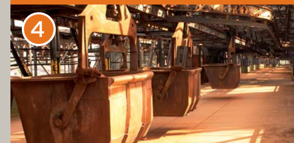
Plate-forme du gueulard : vue panoramique

Sur la plate-forme du gueulard (27 m de hauteur), les bennes suspendues apportaient les matières premières qui étaient versées dans les six hauts-fourneaux. À 45 m de hauteur, la plateforme panoramique offre une vue fascinante sur l'ensemble du site. En suivant le parcours, le visiteur laisse derrière lui le haut-fourneau et descend à son pied où était pratiqué le trou de coulée, d'où la fonte liquide était récupérée.