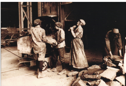
Frauen verladen Masseleisen, Grauguss-Gießerei Völklinger Hütte, um 1916