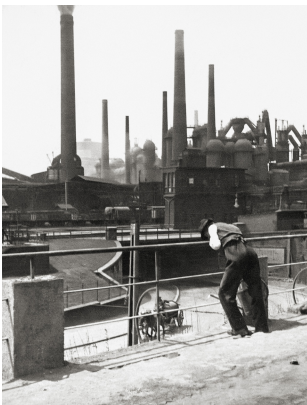
Die Völklinger Hütte, um 1930