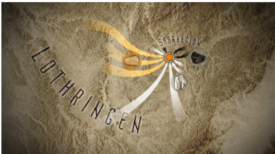
Herkunft der Materialien um 1900. Screenshot aus dem Film BEWEGUNG MACHT GESCHICHTE. Die Völklinger Hütte, 2023